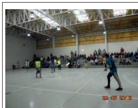
IMG. N° 001 Reinserción Social: Subprograma Laboral. Santiago 1

Comentario Con fecha 25-05-16 en el marco del Subprograma DRAC, Ficha 8.01 Plan Anual, se realizó evento deportivo en Gimnasio correspondiente a final de torneo, con la participación del módulo 35.