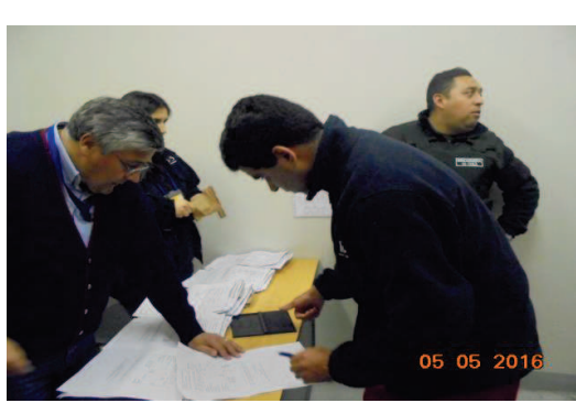
IMG. N° 002 Reinserción Social: Subprograma Laboral, CP Puerto Montt.

Comentario: Con fecha 05-05-2016 se realiza en dependencias del módulo 53-54, pago de 95 internos laborales dependientes en presencia de un funcionario habilitado de Gendarmería de Chile e Inspección Fiscal.